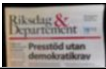
Hotas av tidningsdöd.

Vi hoppas att nya ägare tar över – och intressenter finns, enligt uppgift – men vi hoppas också att tidningen i så fall får behålla sin oberoende och partipolitiskt obundna ställning. För just detta gör den läsvärd.