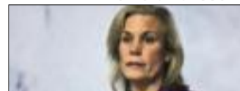
Biståndsminister Gunilla Carlsson, (M).

Jag vill tacka Måns för ett bra jobb. Det är första gången som vi i familjen sett ALLA program av "Allsång på Skansen".