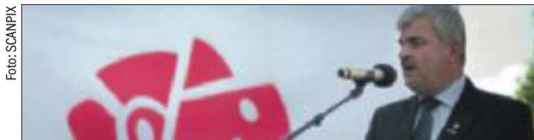
Juholt och hans allierade har ett ord att ta tillbaka, tycker insändaren.

Skriv till oss på inkorgen@aftonbladet.se . Du kan använda signatur, men ange namn i kontakt med redaktionen. Skriv kort - vi förbehåller oss rätten att redigera insänt material.